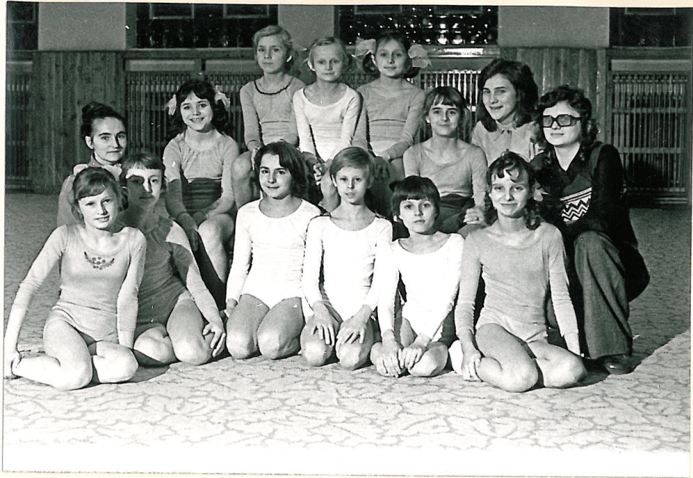
TY BANÍK RATÍŠKOVICE - ZÁVODNICE STRENĚRKAMI